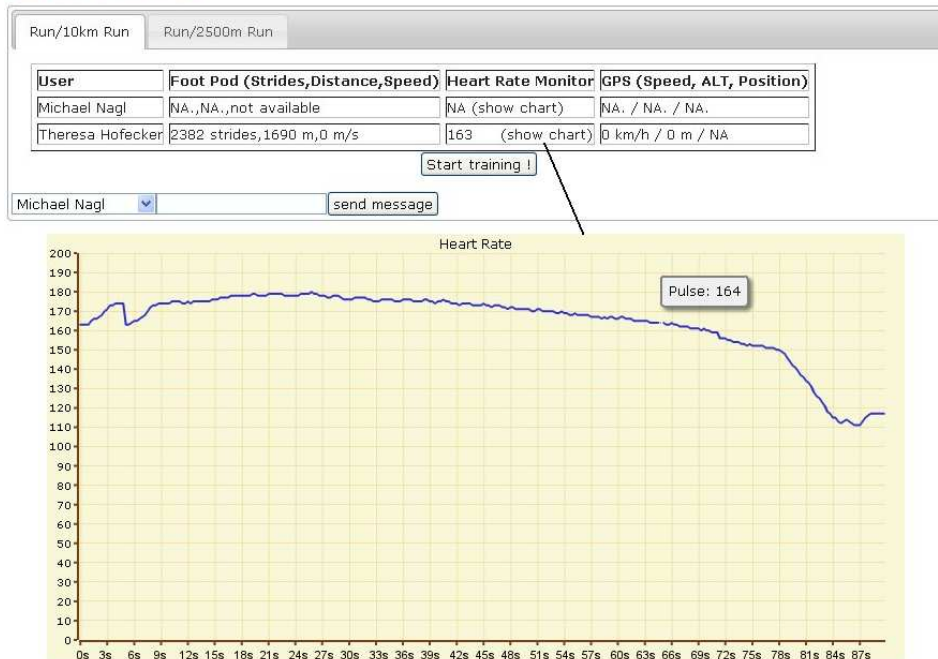
Abbildung 4: E-Client des MMA.